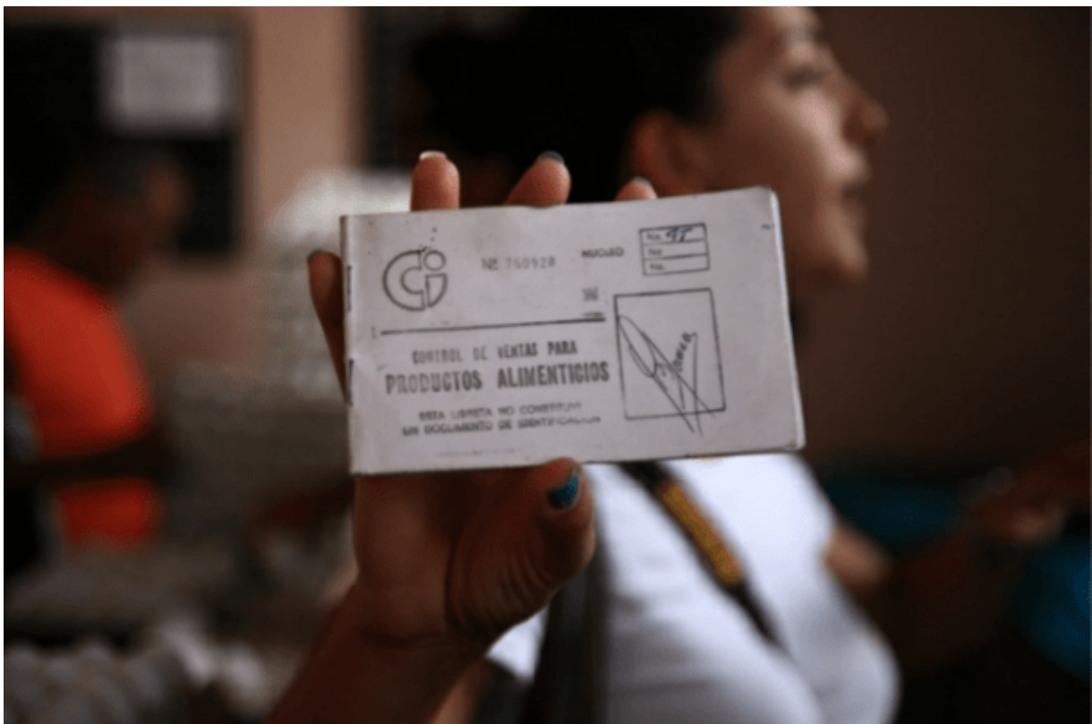
De staat voorziet in een (zeer) elementaire voedselkorf door middel van rantsoenkaarten

Verder moeten we onszelf de vraag stellen hoe de armoede in Cuba kan gemeten worden? Drukken we die uit in BBP(Bruto Binnenlands product) per hoofd? In inkomen (in geld) per dag ? Hanteren we de maatstaven van de kapitalistische economie, waarbij we ons richten op groei- en productiviteitsstatistieken om “succes” of “mislukking” te meten zonder aandacht te besteden aan sociale en politieke prioriteiten?