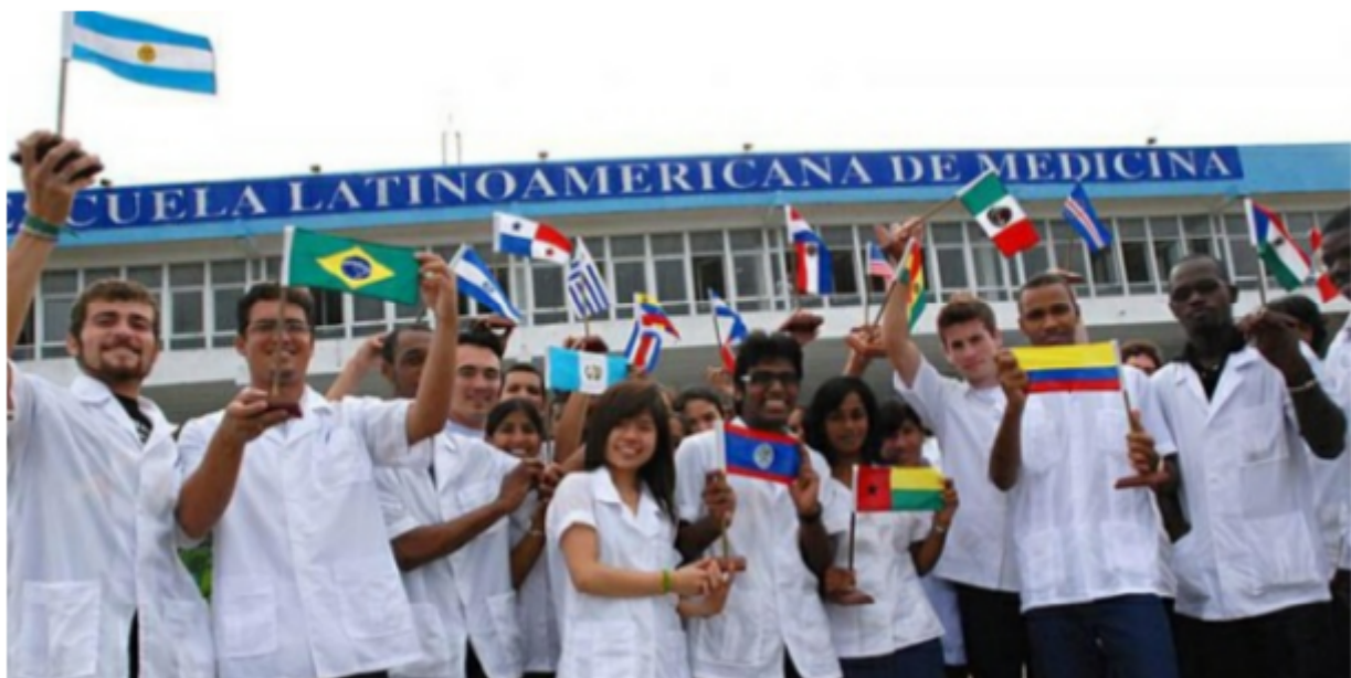
Internationale studenten van de Latijns-Amerikaanse School voor Geneeskunde in Havana

Daar komt nog bij dat Cuba ieder jaar gratis medische verzorging en gratis medische opleidingen verstrekt aan duizenden buitenlanders. Op initiatief van Fidel in persoon, werd in 1999 in Havana de "Latin American School of Medicine" opgericht, om studenten in de medicijnen uit arme landen een zes jaar durende opleiding te geven. Niet alleen de opleiding is gratis, er wordt ook gezorgd voor accommodatie. In 2004 werkte Cuba samen met Venezuela in het project "Operation Miracle", dat in 36 landen gratis oogoperaties aanbood. In de eerste tien jaar van "Operatie Mirakel" werd bij meer dan 3 miljoen mensen het gezichtsvermogen hersteld.